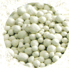
KALKDÜNGER Algenkalk, Magnesiumkalk, Kohlensaurer Kalk