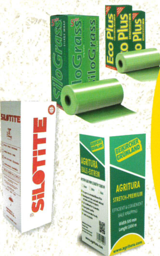
WICKELFOLIE & NETZ