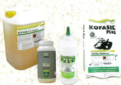
SILIERHILFSMITTEL Kofasil und Pioneer

Jetzt bestellen mit FRÜHBEZUGSRABATT und größtmöglicher Auswahl!