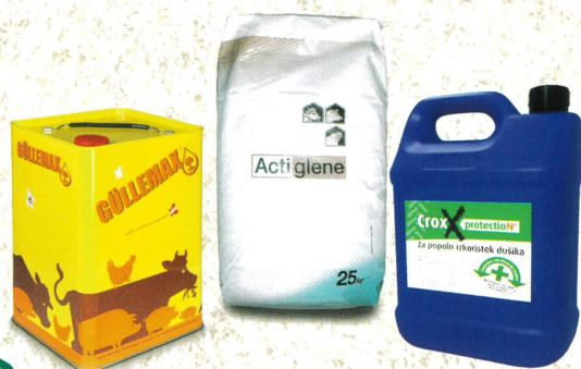
GÜLLEZUSÄTZE Actiglene, Güllemax, CroxxProtection – Nitrifikationshemmer