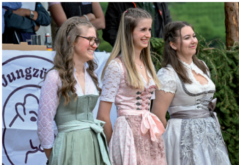
Drei Kandidatinnen für die Prinzessinwahl